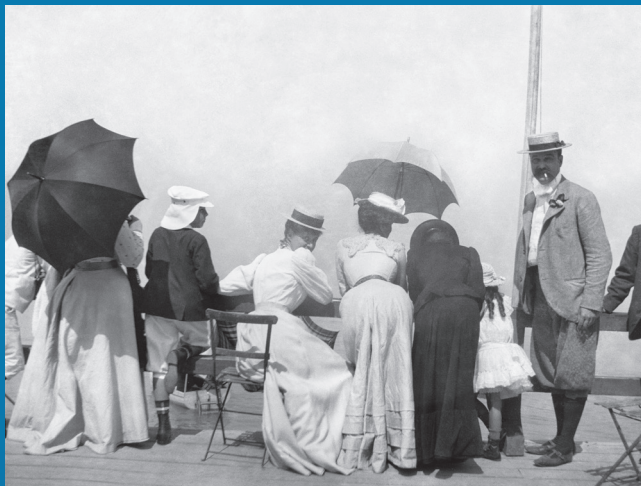
Etretat, juillet 1907